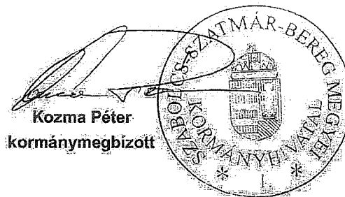
Kozma Péter kormány megbízott

Digitálisan aláírta: Szervezeti aláíró tanúsítvány DN: c=HU, l=Nyíregyháza, o=Szabolcs-Szatmár-Bereg Megyei Kormányhivatal, serialNumber=DO20141202-1DO5, cn=Szervezeti aláíró tanúsítvány, postalCode=4400, street=Hősök tere 5. Dátum: 2016.03.31 09:43:05 +02'00'